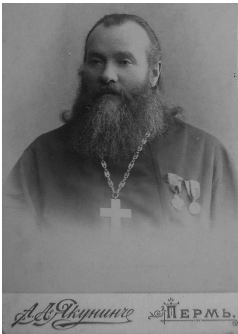
Фото 3. Протоиерей Стефан Александрович Луканин, основатель Белогорского Свято-Николаского миссионерского мужского монастыря, духовник Пермской духовной семинарии