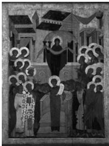
Рис. 5. Икона Покрова Пресвятой Богородицы Суздальского Покровского монастыря, XVI в.

Следует сказать, что описание иконы Покрова Пресвятой Богородицы дается в иконописном подлиннике Большакова.