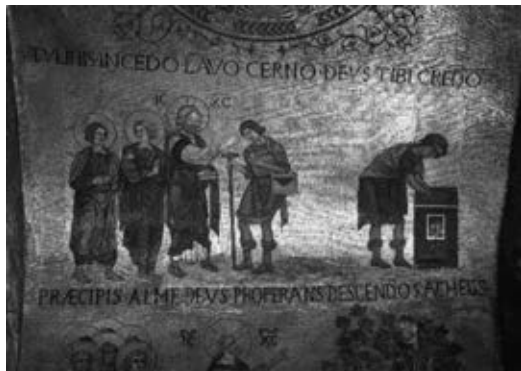
Рис. 6. Мозаика Сан-Марко, Венеция

В клеймах оборота сиенской «Маэсты», выполненной для Сиенского собора Дуччо ди Буонинсеня (см. Рис. 7). Здесь необычных решений мы не встретим фактически никаких, пока не наступит время, связанное с новым прочтением Евангелия и с интересом к нему конца XIX века.