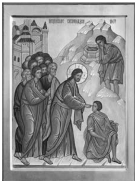
Рис. 1. Исцеление слепорожденного. Современная икона

Перед началом работы на доске мне было необходимо сделать иконографический анализ образа, а именно: изучить развитие данной иконографии в исторической ретроспективе, проанализировать древние и современные образцы икон, а также изучить особенности написания данного образа.