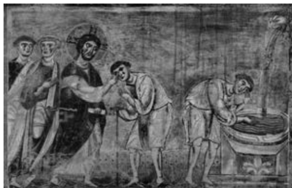
Рис. 4. Армянская рукопись

как отец указывает пальцем на него, а тот смело показывает себе на глаза, как бы говоря: «Я знаю только, что был слеп, а теперь вижу» (Ин. 9, 25). Этот слепорожденный во всех памятниках, находившихся под влиянием византийской иконографии, описывается в двух сценах: и во фресках середины XI века, в базилике Сант-Анджело-ин-Формис (см. Рис. 5), и в мозаиках Сан-Марко (см. Рис. 6) (правда, в очень зарежавшем виде).