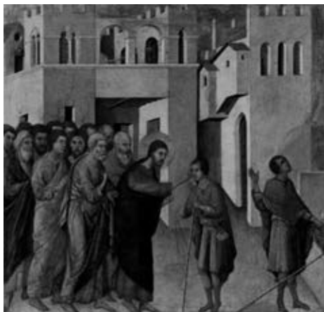
Рис. 7. Клеймо сиенской маэсты из Сиенского собора Дуччо ди Буонинсенья

За Господом видны апостолы, а вдали купель с водою и слепец, промывающий глаза свои» [3].