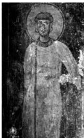
Рис. 2. Св. Роман Сладкопевец, фреска, XII в, Греция

В последствии орарь приобрел другое символическое значение и стал частью облачения духовенства как почетное отличие.