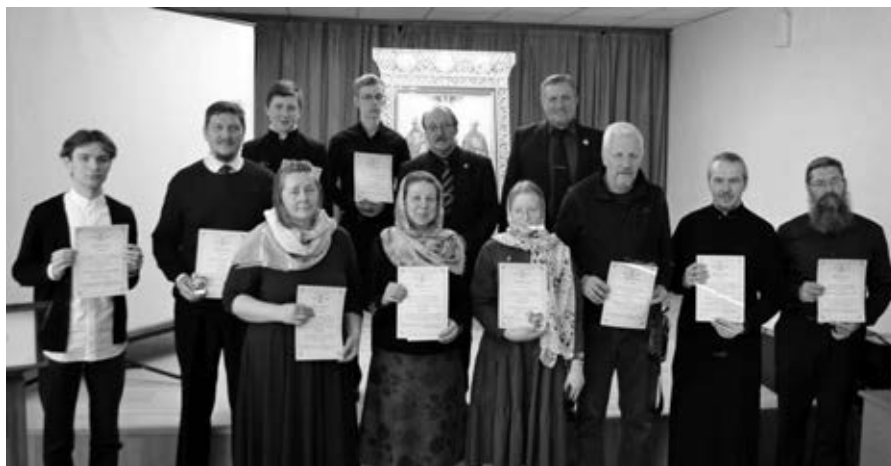
Фото 4. Победители и призеры конкурса студенческих научно-исследовательских работ

на тему: «Трактовка понятия «соборность» в документах Всероссийского Поместного собора 1917-1918 гг.».