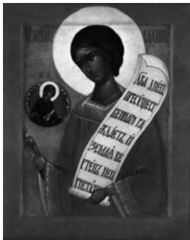
Рис. 4. Икона св. Романа, написанная монахиней Иулианией

Распространение получила иконография с образом св. Романа на иконе Покрова Пресвятой Богородицы (см. Рис. 5). Конечно, св. Роман не мог присутствовать во время этого события, которое произошло в X веке. Но это объясняется тем, что Покров Пресвятой Богородицы был явлен в том же Влахернском храме, где пять столетий, назад молился святой. И чудо Покрова совпадает с днем его памяти.