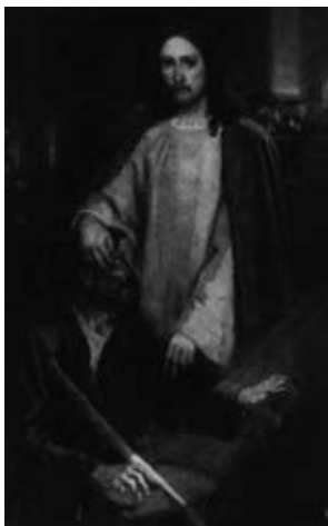
Рис. 8. В. И. Суриков. Исцеление слепорожденного

За Господом видны апостолы, а вдали купель с водою и слепец, промывающий глаза свои» [3].