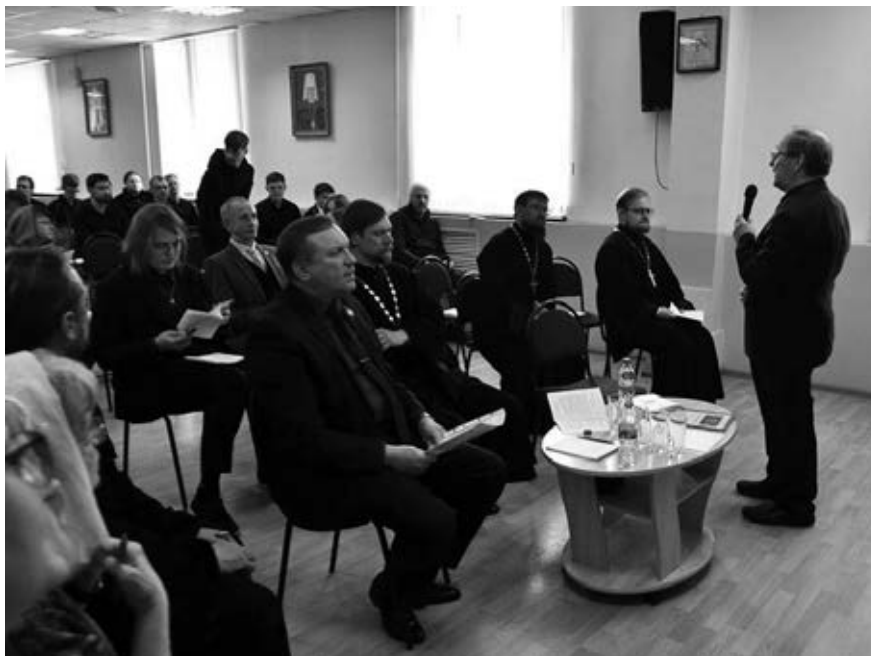
Фото 1. Пленарное заседание научно-богословской конференции Пермской духовной семинарии

140-летию со Дня рождения Павла Александровича Флоренского и настоящий форум, связанный с именами великих сынов земли русской - преподобного Сергия Радонежского и А.С. Пушкина.