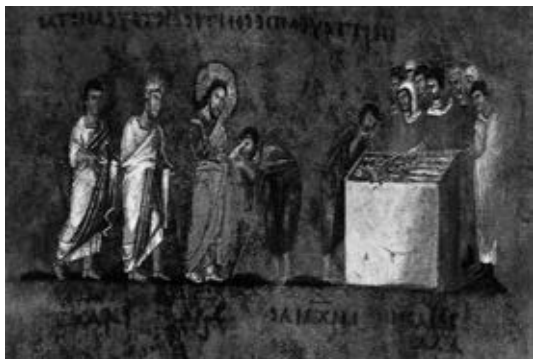
Рис. 2. Миниатюра из Синопского кодекса

Рис. 3) мы это очень хорошо видим. Конечно, это особенность сирийской, восточной иконографии. Пурпурные кодексы, включая два Евангелия: Синопское (см. Рис. 2) и Россанское, (см. Рис. 3) происходят из антиохийской территории, и в них миниатюры очень точно следуют тексту.