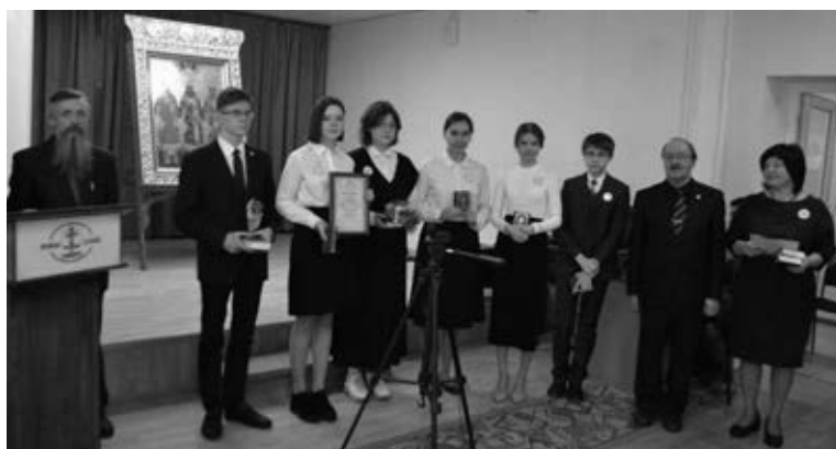
Фото 3. Победители VIII Молодежных историко-просветительских игр «Magistra Vitae» - команда Пермской православной классической гимназии

Стало хорошей традицией награждение на Пленарном заседании конференции учащихся средних школ - победителей и финалистов VIII Молодежных историко-просветительских игр «Magistra Vitae».