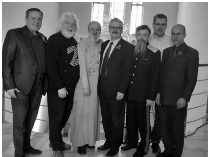
Фото 8. Участники круглого стола "Мир и война"

Всего в ходе работы конференции выступили с докладами 91 человек, в том числе 2 доктора наук, 9 кандидатов наук (богословия), 20 священнослужителей, 32 семинариста, 12 преподавателей семинарии, 4 руководителя епархиальных отделов, 9 представителей светских учреждений.