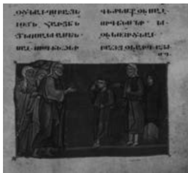
Рис. 3. Миниатюра из Россанского Евангелия

Рядом с этим умывающимся слепорожденным стоят явно гневающиеся персонажи. Один из них в талите на голове (это фарисей). Увидев, что с ним произошло, они, как мы помним, говорят ему: «Побойся Бога, человек этот грешник» (Ин. 9, 24). А тот отвечает: «Я знаю лишь, что был слеп и теперь вижу» (Ин. 9, 25). И, более того, у него хватает силы духа и дерзости ответить спрашивающим о том, кто его исцелил, и смело их спросить, не хотят ли и они стать учениками Иисуса (Ин. 9, 27).