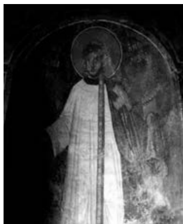
Рис. 3. Св. Роман Сладкопевец, фреска, 1316 г., Македония