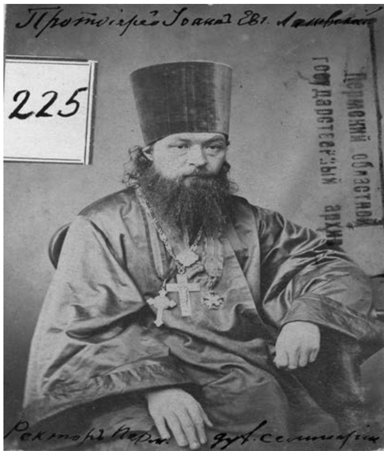
Фото 1. Ректор Пермской Духовной семинарии протоиерей Иоанн Евгеньевич Лаговский, автор «Истории Пермской Духовной семинарии»