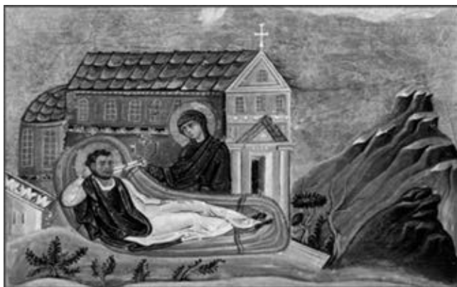
Рис. 1. Рукопись, Менологий Василия II, X век.

Одним из основных источников иконографии образа этого святого является Менологий Василия II. Он относится к концу X века (см. Рис. 1).