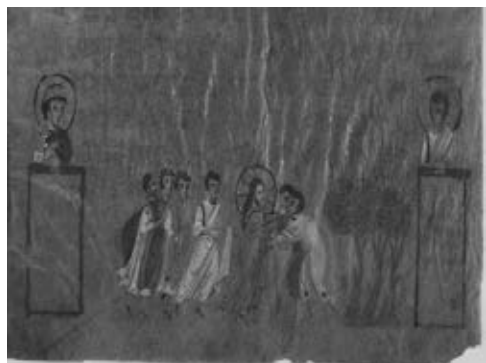
Рис. 5. Фреска из базилики Сан-Анджело-ин-Формис

как отец указывает пальцем на него, а тот смело показывает себе на глаза, как бы говоря: «Я знаю только, что был слеп, а теперь вижу» (Ин. 9, 25). Этот слепорожденный во всех памятниках, находившихся под влиянием византийской иконографии, описывается в двух сценах: и во фресках середины XI века, в базилике Сант-Анджело-ин-Формис (см. Рис. 5), и в мозаиках Сан-Марко (см. Рис. 6) (правда, в очень зарежавшем виде).