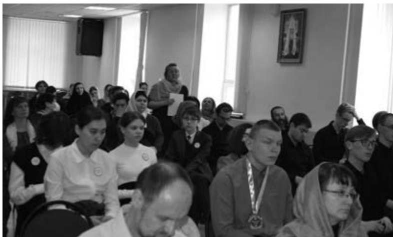
Фото 6. На пленарном заседании