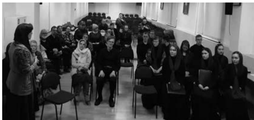
Фото 3. Участники вечера памяти о. Вадима Лунегова 4 апреля 2022 г.

Всегда следовало поздравление, продолжительная отеческая проповедь и тихое мирное чаепитие. В такие минуты всех удивляло, как уставший от множества дел священник может так щедро дарить тебе столько тепла и любви. Откуда у батюшки силы?